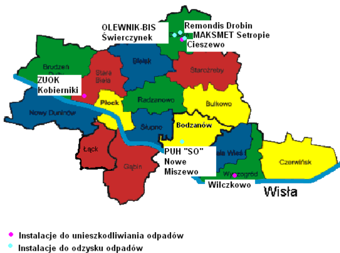
Rysunek 2 Lokalizacja miejsc unieszkodliwiania i odzysku odpadów na terenie Związku Gmin Regionu Płockiego