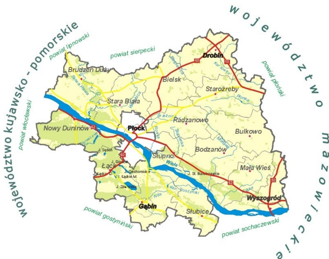
Mapa 1. Gmina Nowy Duninów na tle powiatu płockiego.