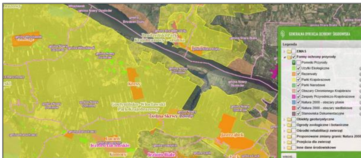
Rysunek 4. Obszary chronione w Gminie Nowy Duninów