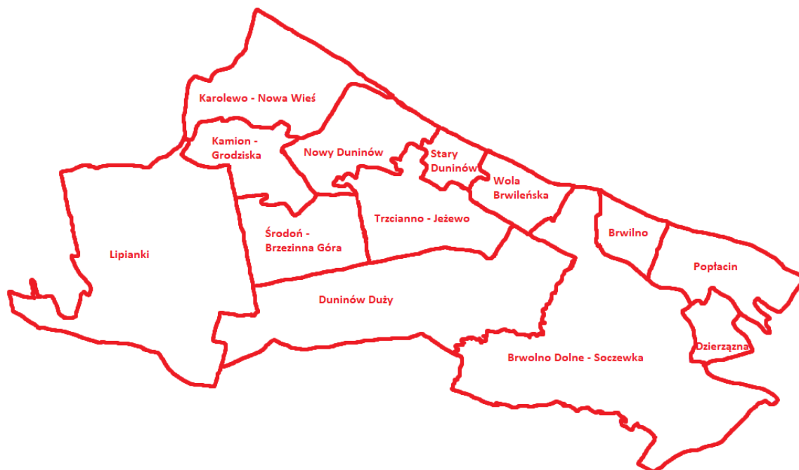
Rysunek 3. Gmina Nowy Duninów z podziałem na sołectwa