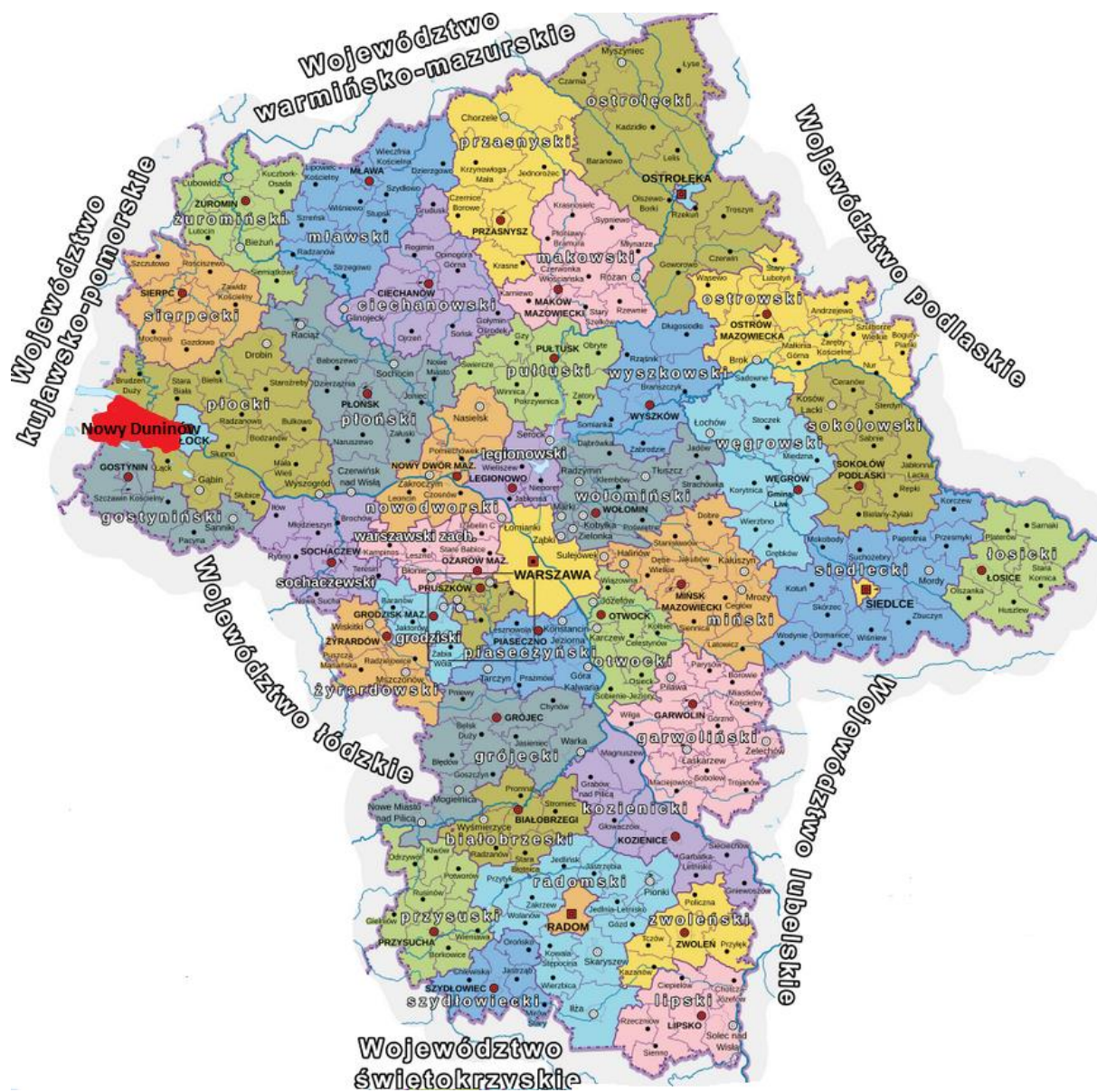
Rysunek 2. Położenie Gminy Nowy Duninów na tle województwa mazowieckiego