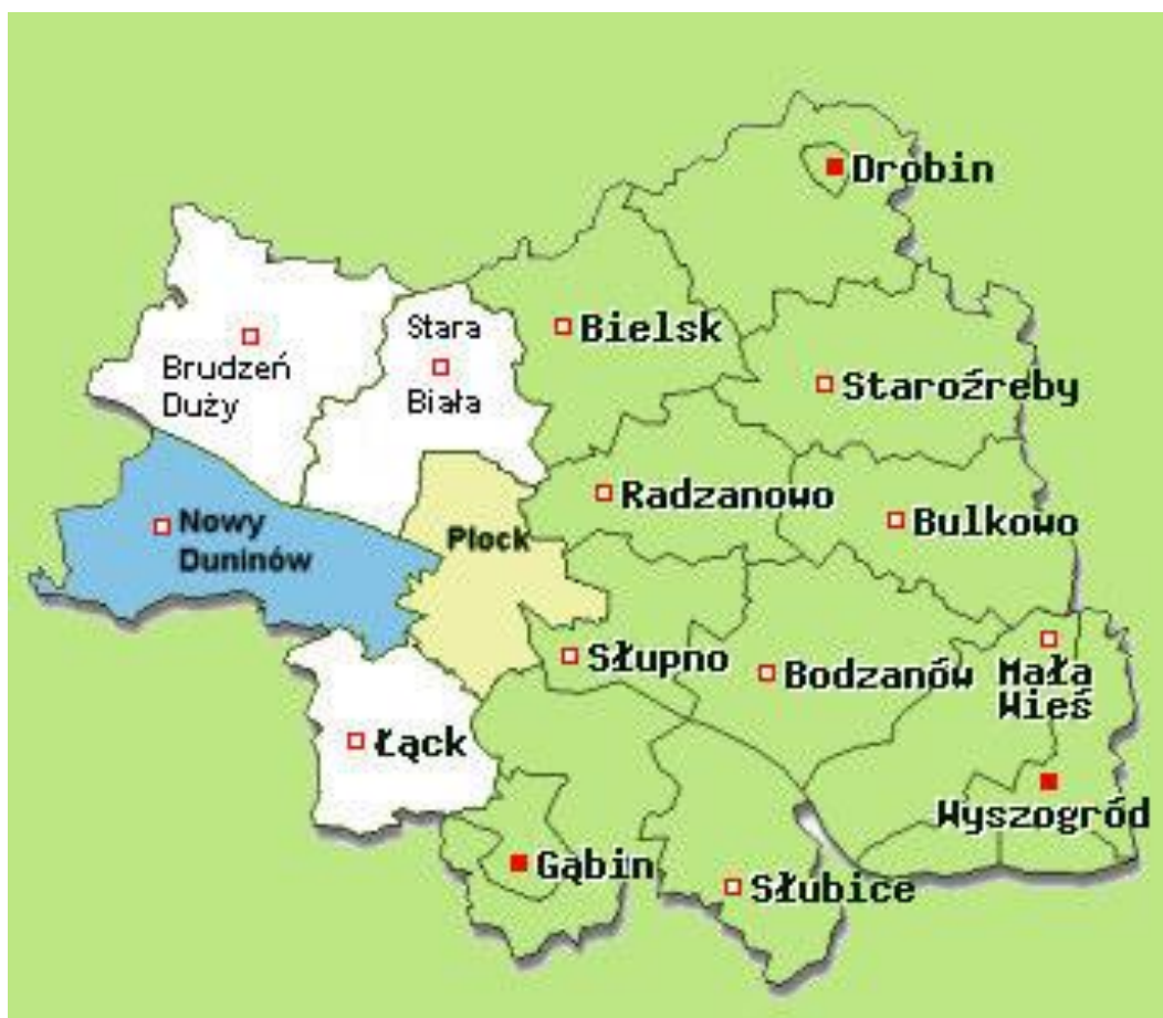
Rysunek 1. Położenie Gminy Nowy Duninów na tle powiatu płockiego

Gmina Nowy Duninów leży w powiecie płockim, w województwie mazowieckim. Na koniec 2020 r. odnotowano 3 906 zameldowanych na stałe mieszkańców Gminy.